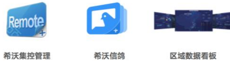
图6：希沃数据管理与服务产品

为助力学校实现校园应用场景的全面信息化管理，希沃开发了数据管理与服务应用软件，主要为希沃集控管理软件、希沃信鸽、区域数据看板等产品，旨在辅助教学管理决策，助力教学优化。