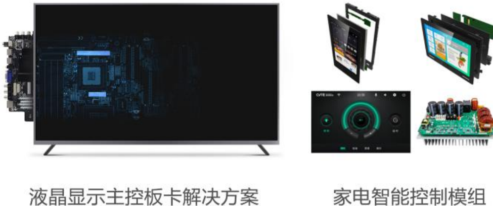
图1：部件业务主要产品

在液晶显示主控板卡领域，公司基于Mstar、MTK、Realtek、Amlogic、RDA、海思等主流芯片平台，推出了可支持全球主流电视信号标准的液晶电视主控板卡产品体系。公司还通过产品功能的整合（例如二合一板卡、三合一板卡、四合一板卡、五合一、六合一板卡、智能电视板卡等）提高产品的附加值。