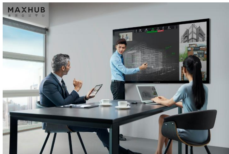
图7：MAXHUB交互智能平板产品

企业服务业务以MAXHUB高效会议平台为核心产品，通过交互智能显示终端、传屏盒子、云会议等多维的软硬件产品，能够满足用户全会议场景的沟通需求，为用户带来显示、交互、协同的一体化体验，营造高效协同的办公方式。MAXHUB会议平板是一款集投影仪、电子白板、远程设备、平板电脑、会议音响于一体的会议终端，产品具有高清显示、触摸书写、无线传屏等功能，具备远程会议配置，兼容多种远程会议软硬件，可搭载丰富的办公应用，可应用于金融机构、科技行业、地产企业、咨询服务行业、政务组织等各行业领域的会议场景中。