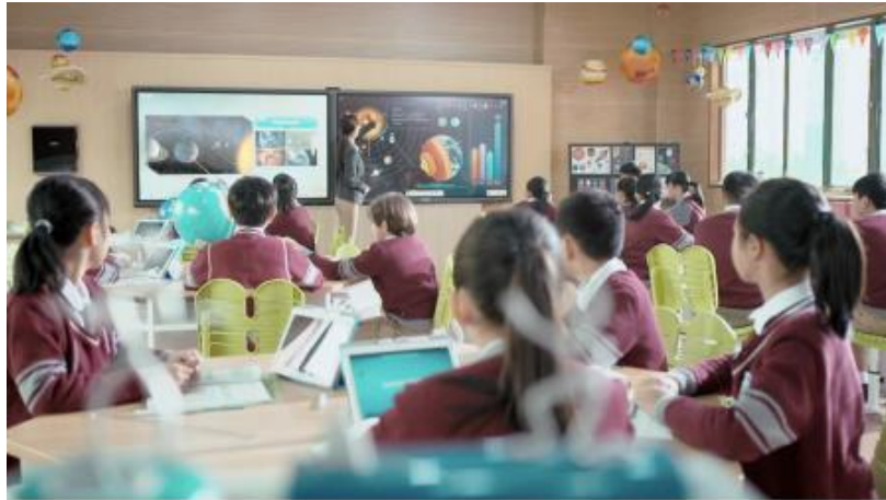
图2：希沃教学应用场景