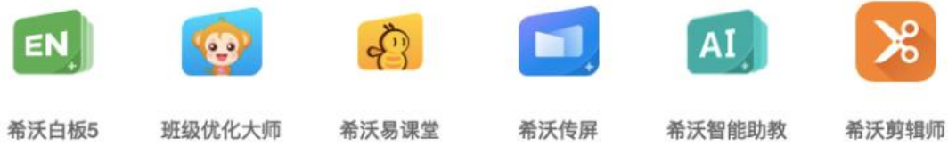
图5：希沃常态化应用软件产品