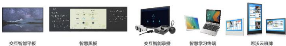
图4：希沃数字化硬件产品

交互智能平板是教育数字化环境硬件的核心产品，又称交互式液晶一体机，是以高清或超高清液晶屏显示，集Windows、Android双系统一体设计，可实现系统间数据互传共享，白板书写、演示和多种格式的多媒体课件播放，教育应用商城SeewoStore资源开放共享，具有强兼容性、响应速度快、低辐射，低功耗的特点。除此之外，数字化环境硬件产品还包括智慧黑板、交互智能录播、希沃云班牌、智慧学习终端等。